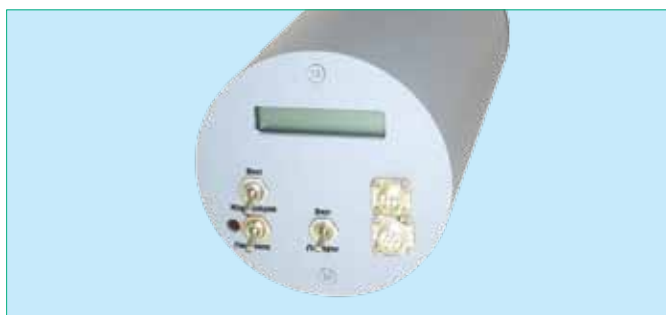
Рис.4 Стационарные пирометры спектрального отношения ДИЭЛТЕСТ-ТЦ

Для ряда материалов, в том числе высоколегированных сталей, была исследована зависимость \epsilon_\lambda от \lambda . Оказалось, что для приборов серии ДИЭЛТЕСТ-ТЦ можно подобрать универсальную корректирующую кривую, подходящую как для чистого железа и высоколегированных сталей, так и для ряда других металлов (никель, кобальт и т.п.). При этом для большинства этих металлов коррекция возможна до уровня, при котором погрешность измерений в диапазоне температур от 600 до 2400°C составляет всего 1–1,5% (для кобальта – до 2%). Коррекция показаний осуществляется переводом в