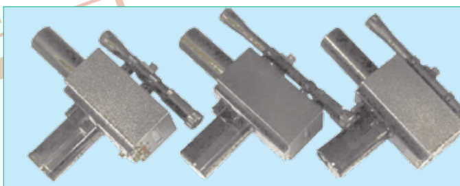
Рис.3 Переносные пирометры спектрального отношения ДИЭЛТЕСТ-ТЦхП

серьезнейший недостаток. При измерении объекта вы должны довольно точно знать его излучательную способность. В ряде случаев можно требуемую информацию получить из справочников. Но очень часто в них или нет данных на ваш объект, или приведенные данные некорректные (к примеру, справедливы для пирометра, работающего в ином спектральном диапазоне, чем ваш). Так что вместо задачи по измерению температуры объекта перед вами встает задача определения правильного значения коэффициента коррекции. И иногда вторая задача оказывается вовсе не проще первой. Кроме этих радиационные пирометры имеют ряд иных существенных недостатков, их результаты зависят от: расстояния до измеряемого объекта, формы объекта, запыленности и загазованности промежуточной среды, наличия защитных стекол и непрозрачных объектов в поле зрения пирометра, боковых засветок при работе с крупноразмерными объектами, переотражений измеряемым объектом излучения сильно нагретых объектов, расположенных рядом. Как видите, факторов, мешающих получению радиационными пирометрами точных результатов, набирается с десяток. Именно поэтому пользователи все чаще и чаще задумываются об использовании пирометров спектрального отношения, более дорогих, чем радиационные, но свободных от всех вышеперечисленных недостатков.