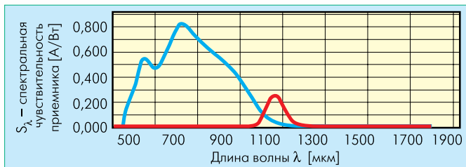
Рис. 2 Спектральные характеристики приемника в пирометрах ДИЭЛТЕСТ: синяя кривая – коротковолновая область, красная – длинноволновая

ниевых чайника, один из которых только снят с полки магазина, а другой, изрядно закопченный, более десятка лет ежегодно вывозился в туристские походы и на слеты. Представьте также, что оба они залиты под завязку водой и доведены до кипения. Если мы попробуем измерить температуру стенок этих чайников хорошо настроенным радиационным пирометром, то при измерении закопченного чайника пирометр покажет температуру от 90 до 98 градусов, а при измерении блестящего полированного – от 25 до 35 градусов. При этом вода в них кипит, т.е. температура внутренних поверхностей обеих стенок около 100 градусов.